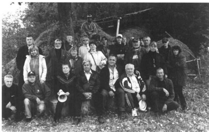
Знімальна група фільму «Інше життя, або втеча з того світу». Чернігівщина. Жовтень 2005р.