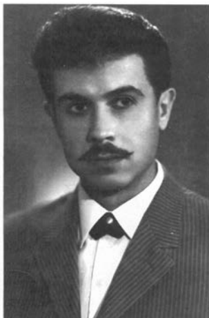
м. Черкаси. Вересень 1967р.