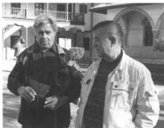
Бахчисарай. Листопад 2008 р.