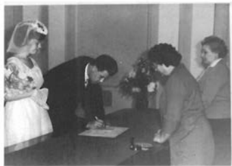
Весілля. 17 вересня 1964р.