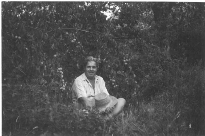
Мельники. Липень 2002р.