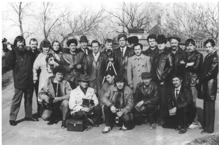
Кінолюбителі м. Черкаси. Весна 1987 рік.