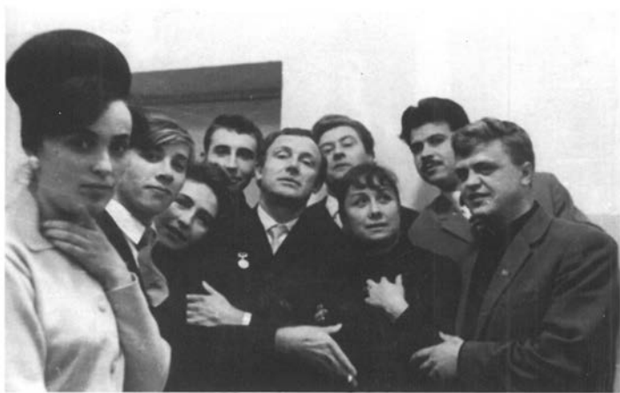
Дни РСФСР в Украине. Встреча с лауреатом Ленинской премии, засл. арт. РСФСР Иннокентием Смоктуновским. Черкасский драмтеатр. Октябрь 1967 год.