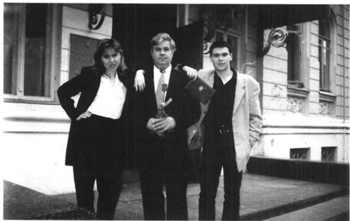
Нагородження званням «Заслужений діяч мистецтв України». З сином та дочкою. 25 квітня 2000р.