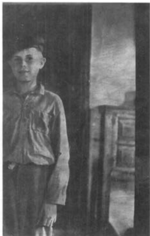
Повоєнні роки 1946-47 роки