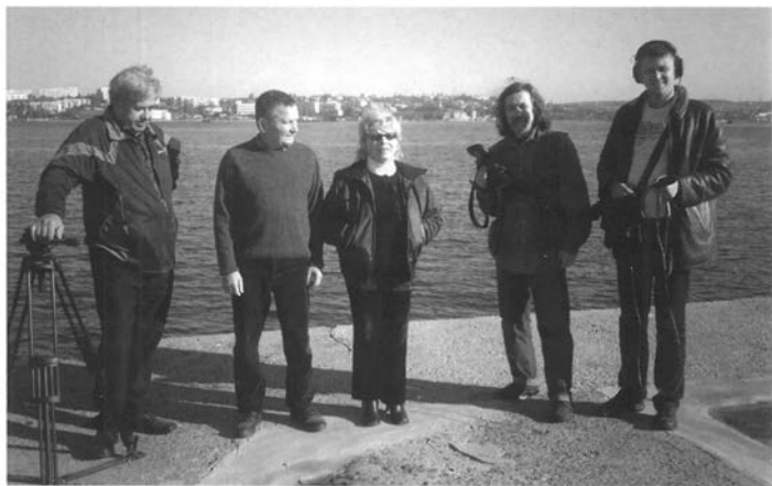
Севастополь, на зйомках фільму. 2008 р.