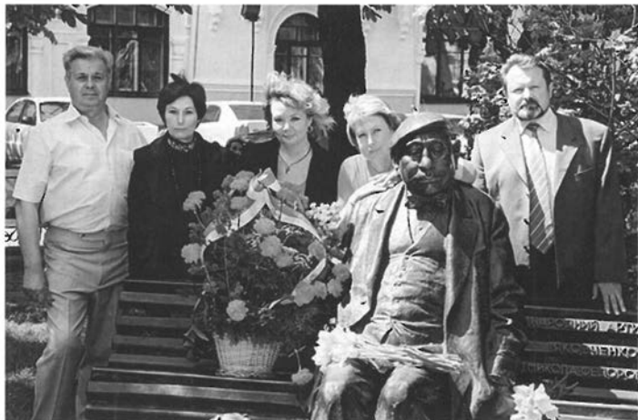
На зйомках фільму «Інше життя, або втеча з того світу».