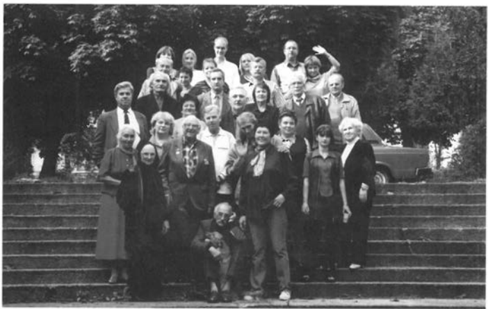
70-ти річчя Київської кіностудії хронікально-документальних фільмів. У дворику студії. Жовтень 2001 року.