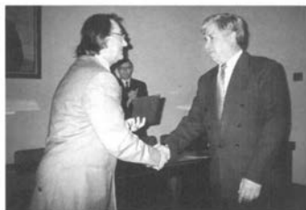
Міністр культури Богдан Ступка вручає диплом «Заслуженого діяча мистецтв»