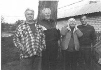
Мельники. 2007 р.